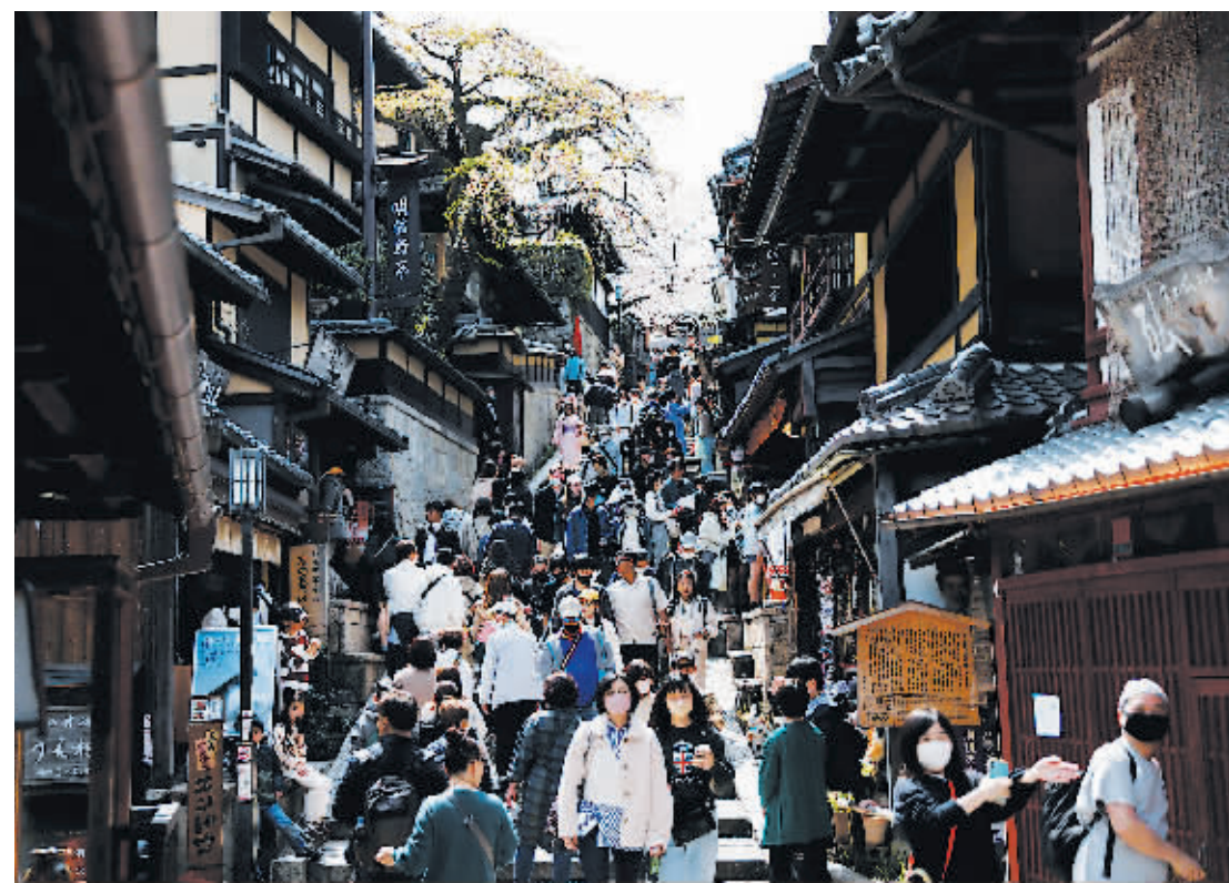
日本京都清水寺拍摄的人群。

据日本总务省12日公布的统计数据,截至2022年10月1日,不计在日本居住的外国人,日本人口总数为1.22031亿,较上年减少75万,创1950年以来最大跌幅。这是日本总人口连续12年出现减少。