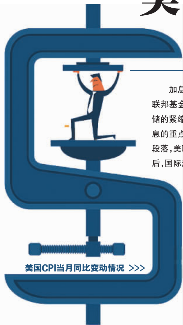
美国CPI当月同比变动情况 >>>

加息一年多后,美国通胀终于回落到了5%。而这个数字与目前4.75%-5%的联邦基金利率目标区间基本持平。这两个数字看似毫无关系,但在历史上,美联储的紧缩周期往往会一直加息到利率高于CPI为止。市场也预计,5月会是本轮加息的重点。不过,剔除能源和食品的核心通胀率依然强劲,银行业危机已暂告一段落,美联储暂难找到有力证据支撑停止加息的选择。此外,“欧佩克+”宣布减产,国际油价更具支撑,威胁通胀回落的前景。