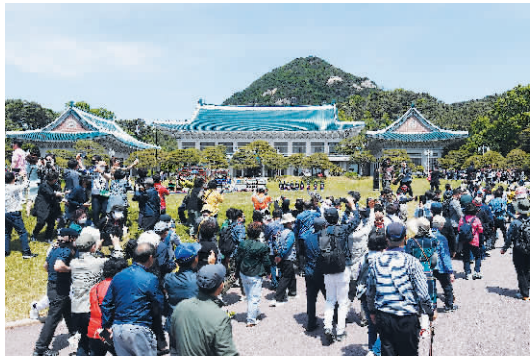
韩国首尔,民众参观青瓦台。

在韩国原总统府青瓦台对外开放将满一周年之际,韩国文化体育观光部正式宣布将把青瓦台打造成“K-旅游地标”。