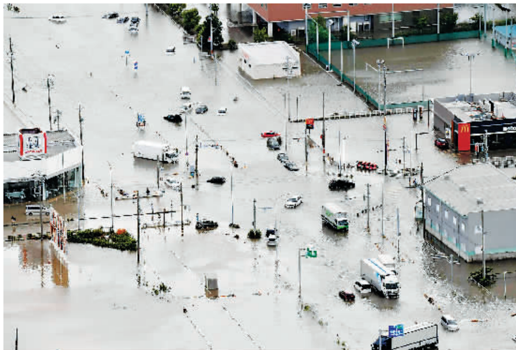
3日,在日本爱知县丰川,多辆汽车被困在洪水中。

上周末,日本大范围暴雨,造成2人死亡,至少35人受伤,约200万人一度接到疏散通知。日本共同社3日援引日本气象厅消息报道,日本西部和中东部地区2日至3日上午雷电交加,连降暴雨;东部多地发生山体滑坡,河水泛滥。8个县中的23个地区24小时降雨量创下历史纪录。