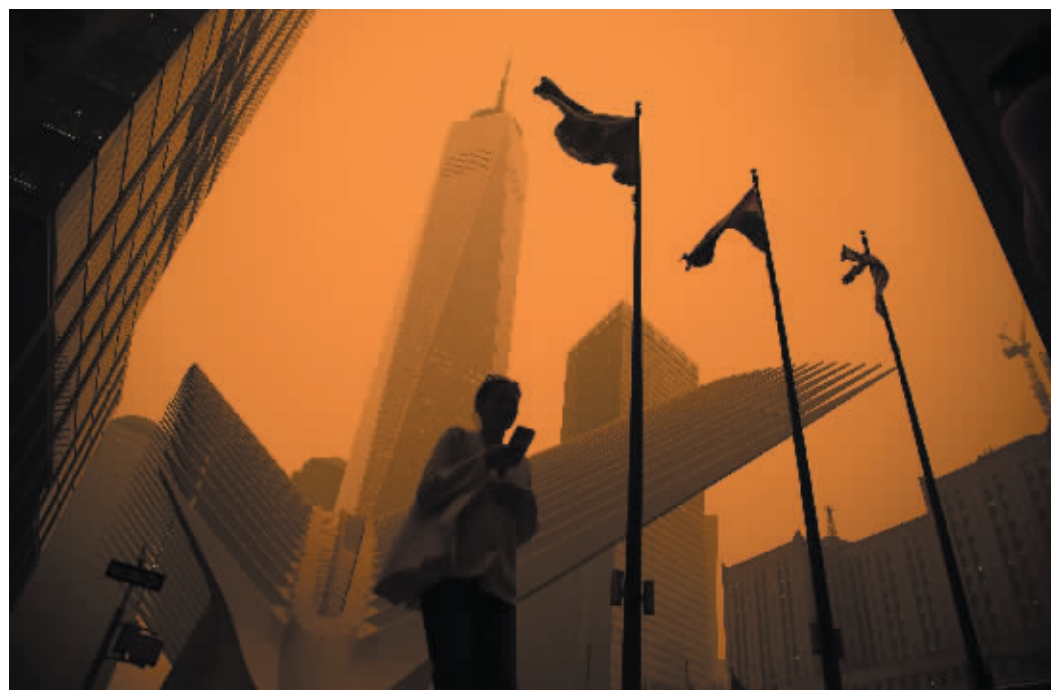
7日,一名行人从烟尘笼罩的美国纽约曼哈顿世贸中心附近走过。

由于加拿大多地森林野火产生的大量烟霾南移,美国纽约市空气7日出现严重污染,民众生活受到影响。