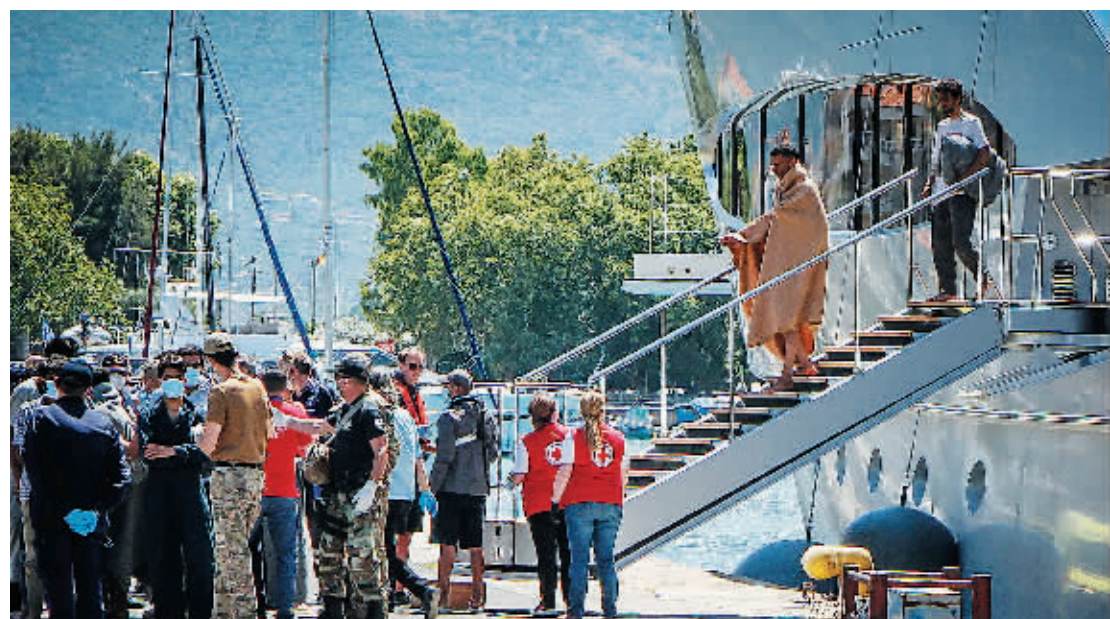
14日，幸存者乘船抵达希腊卡拉塔塔港口。

当地时间14日早上，一艘移民船在希腊附近海域倾覆沉没，已造成至少79人死亡，数百人失踪。这是近年来欧洲最致命的航运灾难之一。据报道，沉船地点位于希腊南部沿海城镇皮洛斯西南大约80公里处。有消息称，这艘船从利比亚出发，一位不愿透露姓名的航运部门官员说，船上大多数来自埃及、叙利亚和巴基斯坦。