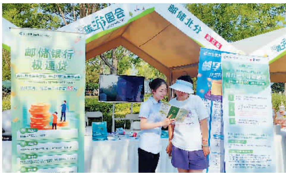
2023年6月17日-18日，邮储银行北京分行参加“零碳游园会”绿色公益活动，向市民介绍绿色金融产品。

在绿色金融发展路上，银行一直扮演着关键角色。近年来，中国邮政储蓄银行北京分行（以下简称“邮储银行北京分行”）积极贯彻国家政策和监管要求，认真落实总行2023年碳达峰碳中和暨绿色金融工作要点，围绕对外与对内绿色金融能力的提升，强化制度与能力建设，积极开展碳达峰碳中和相关工作。根据各地区域特色，邮储银行北京分行持续拓宽绿色金融“通衢大道”，为实现双碳目标贡献着自身的力量。