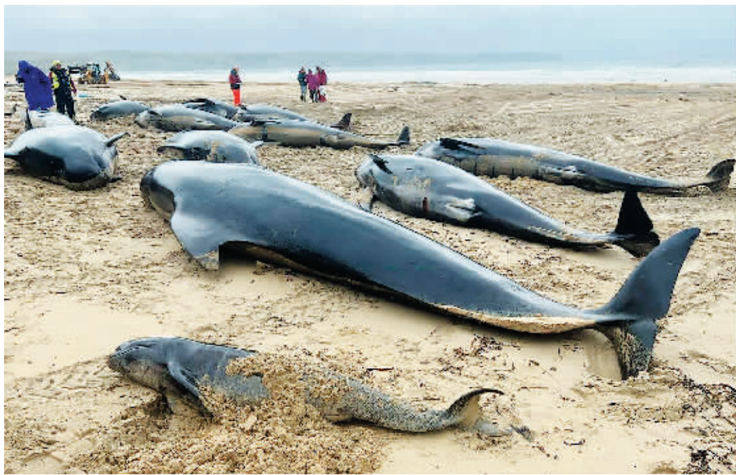
16日搁浅在苏格兰刘易斯岛海滩上的领航鲸。

近日,数十头领航鲸在苏格兰西北部的外赫布里底群岛搁浅,救援人员正在争分夺秒开展救援。