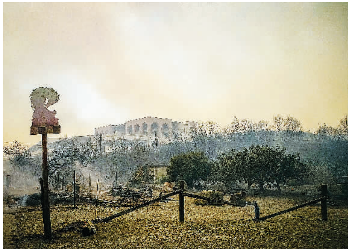
22日，在希腊罗德岛上拍摄的野火引发的浓烟。