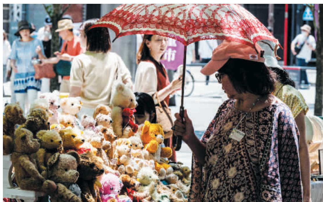
人们在日本东京的露天市场购物。

日本总务省8日公布的调查结果显示，扣除物价因素影响，日本6月实际家庭消费支出同比下降4.2%，连续4个月同比下滑。