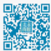
北京商报官方微信