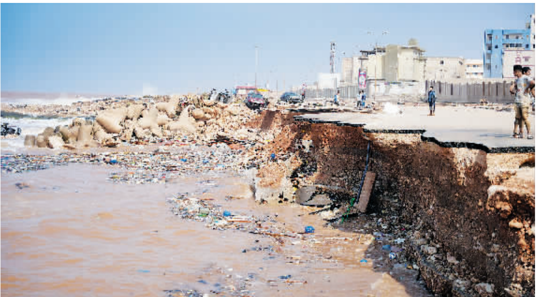
利比亚东部城市德尔纳洪水过后。

据路透社13日报道,受飓风“丹尼尔”影响,洪水摧毁了利比亚东部城市德尔纳四分之一的土地,恐致利比亚数千遇难,至少1万人失踪。利比亚通讯社12日援引利东部政府官员发言称,德尔纳死亡人数已超5300人,另有上万人失踪。红十字会与红新月会国际联合会官员塔赫尔·拉马丹说:“我们可以从独立消息源证实,目前已有至少1万人失踪。”