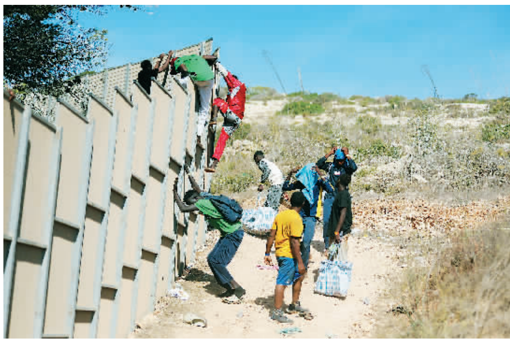
意大利地中海岛屿兰佩杜萨,移民翻越隔离墙。

大批难民和非法移民近日涌入意大利南部兰佩杜萨岛,导致意大利不堪重负。意大利内阁定于18日开会,将确定多项应对移民潮的“特别措施”,包括要求军方建造更大的看管设施,以及延长对非法移民的羁押时间等。