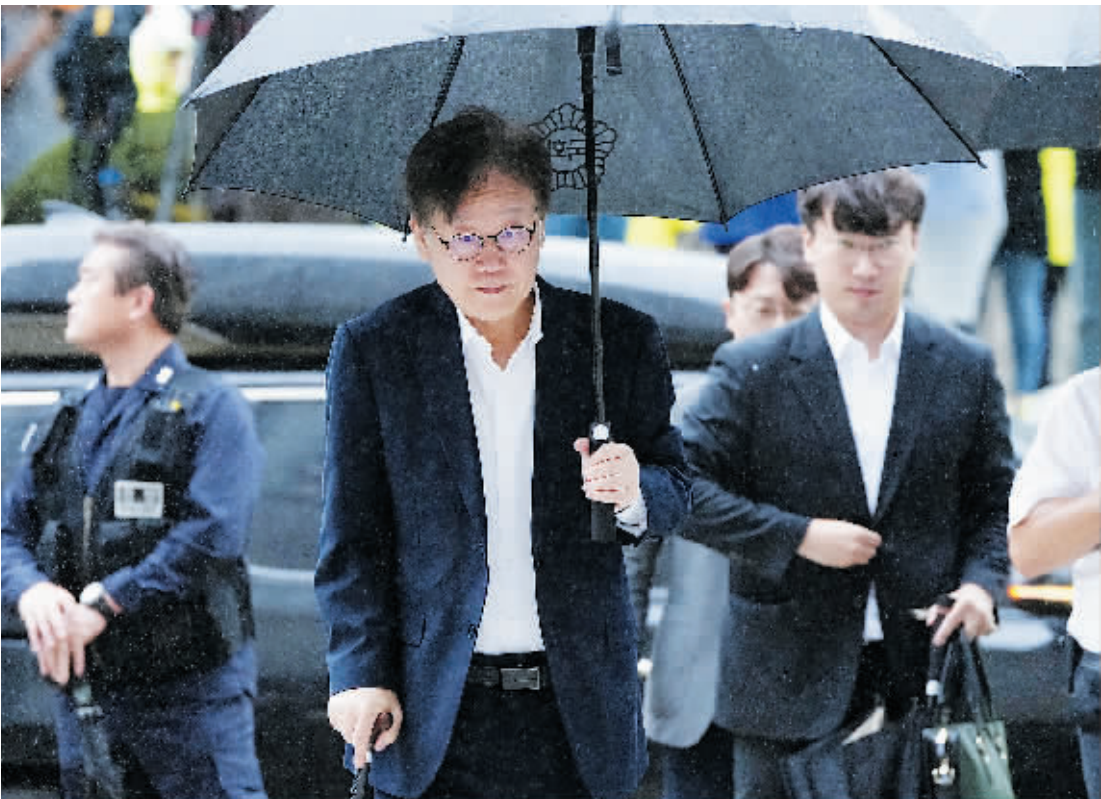
26日，韩国首尔，韩国共同民主党党首李在明将出席拘留前嫌疑人审问，拄着拐杖前往首尔中央地方法院。

一场围绕韩国最大在野党共同民主党党首李在明的法律风波持续了一个多星期的时间，如今暂告一段落。当地时间9月27日凌晨，韩国首尔中央地方法院发布针对李在明的拘捕必要性审查结果，决定驳回检方对李在明的拘捕申请。