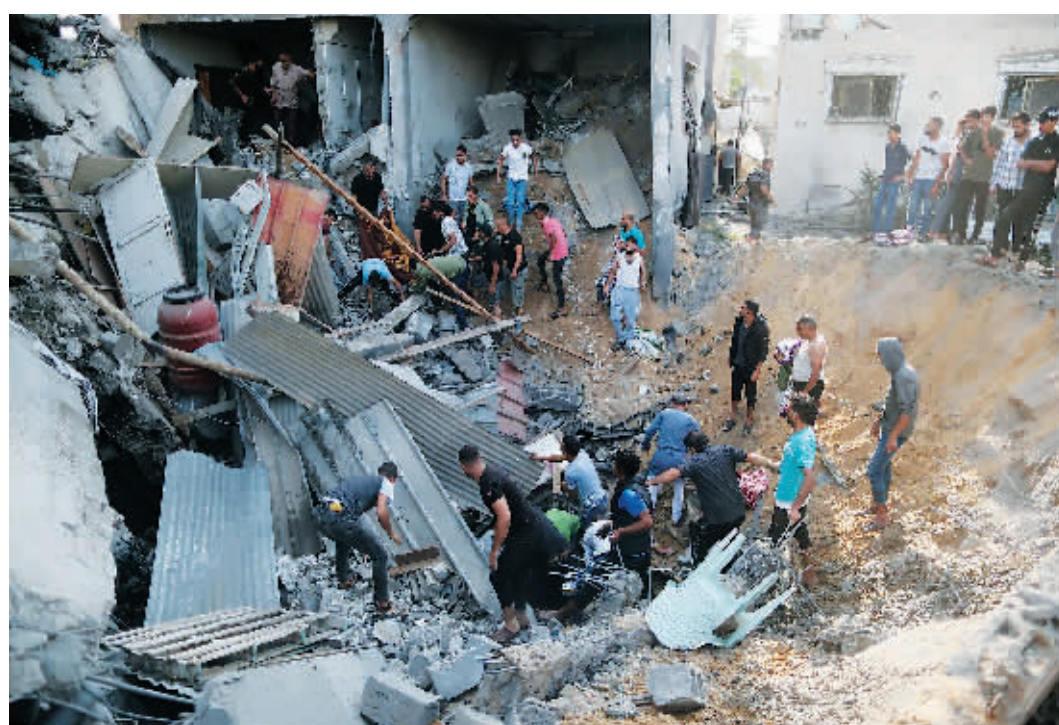
11日,在加沙地带南部城市汗尤尼斯,人们在被以色列空袭摧毁的建筑废墟中寻找幸存者。

当地时间12日凌晨,以色列出动军机对加沙地带多地展开新一轮空袭。据叙利亚媒体报道,以色列空袭了叙利亚大马士革国际机场和阿勒颇机场,两座机场暂停运营。