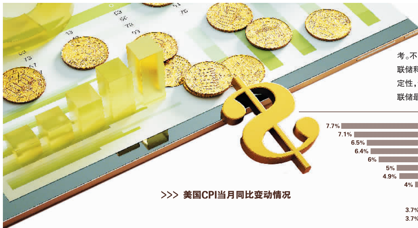
>>> 美国CPI当月同比变动情况