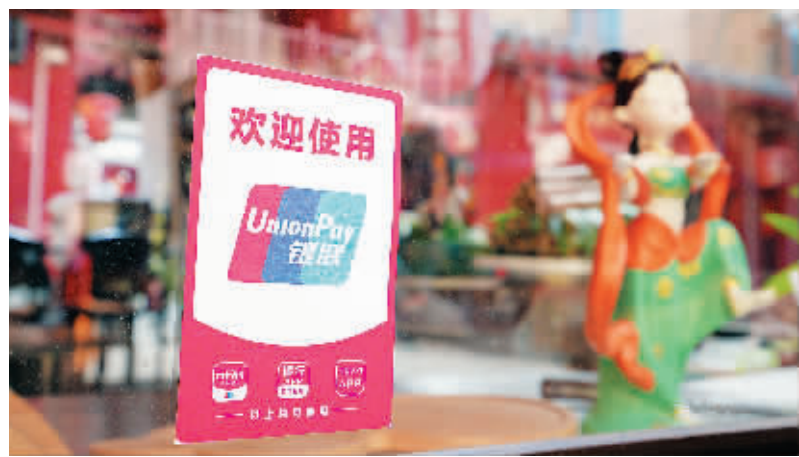
游客可在敦煌的沙洲夜市便捷使用云闪付App

“你们是把敦煌石窟搬到了西安吗?”一位西安市民驻足于地铁二号线钟楼站,他来来回走动,认真观看这场名为“通途”的当代艺术展呈现的4座“石窟”、6幅壁画。以敦煌笔触为形,以共建“一带一路”过程中的基建、物流、文旅、农业、贸易故事为体,中国银联联合敦煌美术研究所以现代技艺再造敦煌新“石窟”、新壁画的形式,致敬经济通途,献礼共建“一带一路”倡议提出十周年。