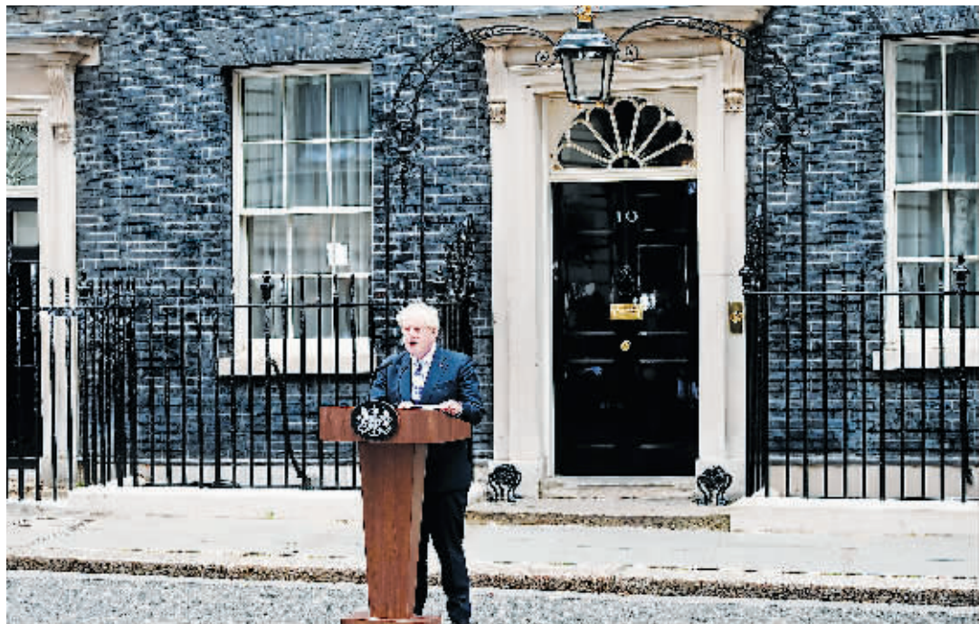
英国前首相鲍里斯·约翰逊在伦敦唐宁街10号门前发表讲话。

据BBC报道,今年早些时候卸任国会议员的英国前首相约翰逊已签约加入英国GB News新闻频道,担任主持人、节目制作人和评论员。BBC认为,预计约翰逊将帮助该新闻频道提高一些收视率。此外,约翰逊还将自2024年开始,为英国《每日邮报》撰写专栏文章。