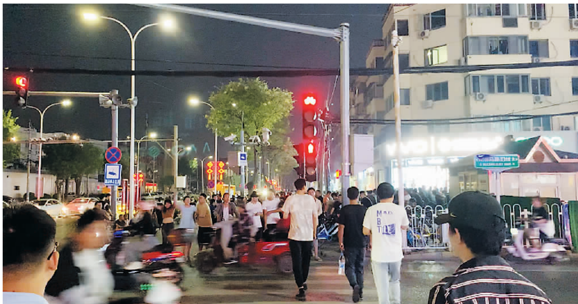
接近晚上7点，人头攒动的马驹桥劳务市场

作为北京地区自发形成的、最大的日结工聚集地之一，一直以来，马驹桥劳务市场为整座城市源源不断地供给着临时劳动力，与此同时，也最为敏感地反映着它的经济生态。