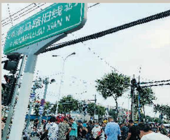
马驹桥劳务市场位于灏马路旧线和兴华中街的交叉路口