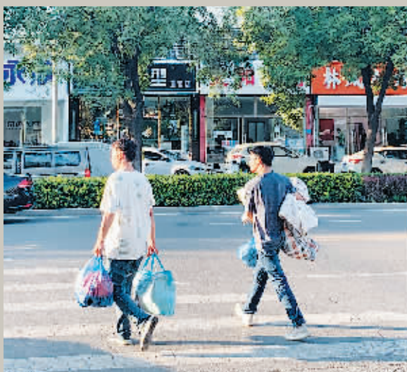
两名零工正抱着被褥，提着行李往马驹桥商业街公交站走去