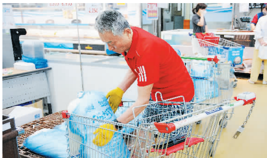
此前10月市民在韩国首尔一家超市购买政府储备海盐。

韩国政府11月9日正式启动“稳定物价特别机制”,指定各部门次官级官员为稳定物价负责人,强化保障民生政策。韩国政府近日组建了“物价有关部门次官会议”的跨部门会议机制,由各部门次官担任物价稳定负责人,推动主要商品价格的稳定。