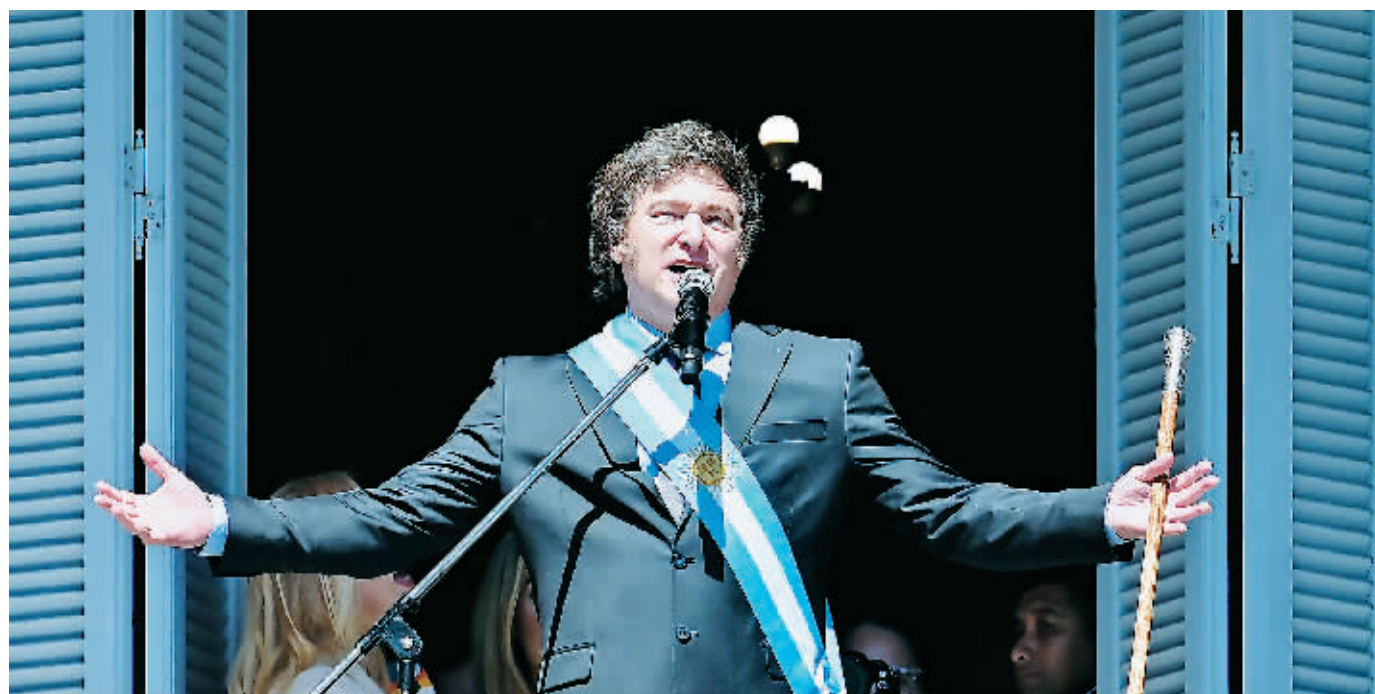
10日，在阿根廷首都布宜诺斯艾利斯，阿根廷新总统米莱在总统府玫瑰宫阳台上向民众发表演说。

的观点和政策设想过于偏激，但对于苦受通胀和货币贬值折磨的阿根廷民众来说颇有吸引力。