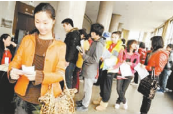
考生报考中戏热情高涨

规划、基本功、戏曲声乐等相关专业课程。中戏的“戏剧戏曲学”是国家级重点学科,但之前戏曲研究相对落后于戏剧,此次京剧表演专业方向的设立并招生,是一种补充和完整。新开设的京剧表演专业约有7-8名任课教师,大部分是中国戏曲学院的退休教授,教学经验丰富,教学水平较高。