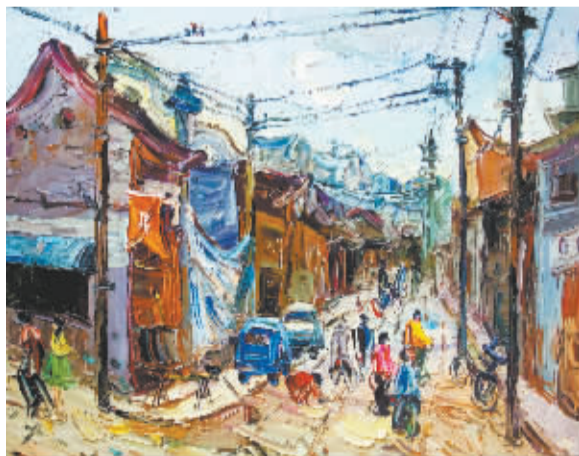
《古镇民居》系列之二 60cm×60cm 布面油画 2010年

画画不是余梅的职业,除了学院附中也没有受过太多正规的美术学院的教育培训,也许因为这个原因,她的画没有那么多拘谨禁锢,随意中有一种大气,色彩在她的画刀下有一种生动的叠加,仿佛有生命、有味道,这味道很芳香,像午后阳