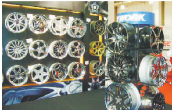
消费者汽车用品消费预期调查

在西郊汽车用品市场,不仅很多新车在假期进行装饰和美容,不少旧车也在为换季采购用品。一位汽车装饰店的销售人员表示,随着气温转暖,汽车装饰也将迎来旺季。“仅