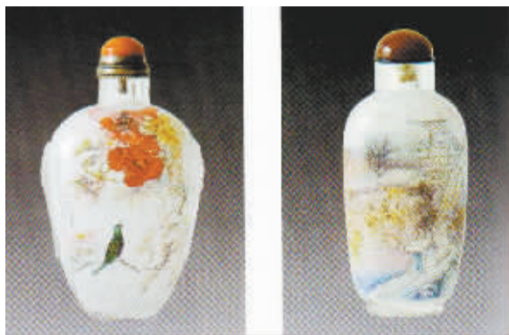
李克昌作品《满堂富贵》、《京师南巡》

璃之乡——山东博山的“明清官窑”,自光绪十六年内画工艺传到淄博,集多种工艺之大成,真正做到了“方寸之间藏乾坤”,