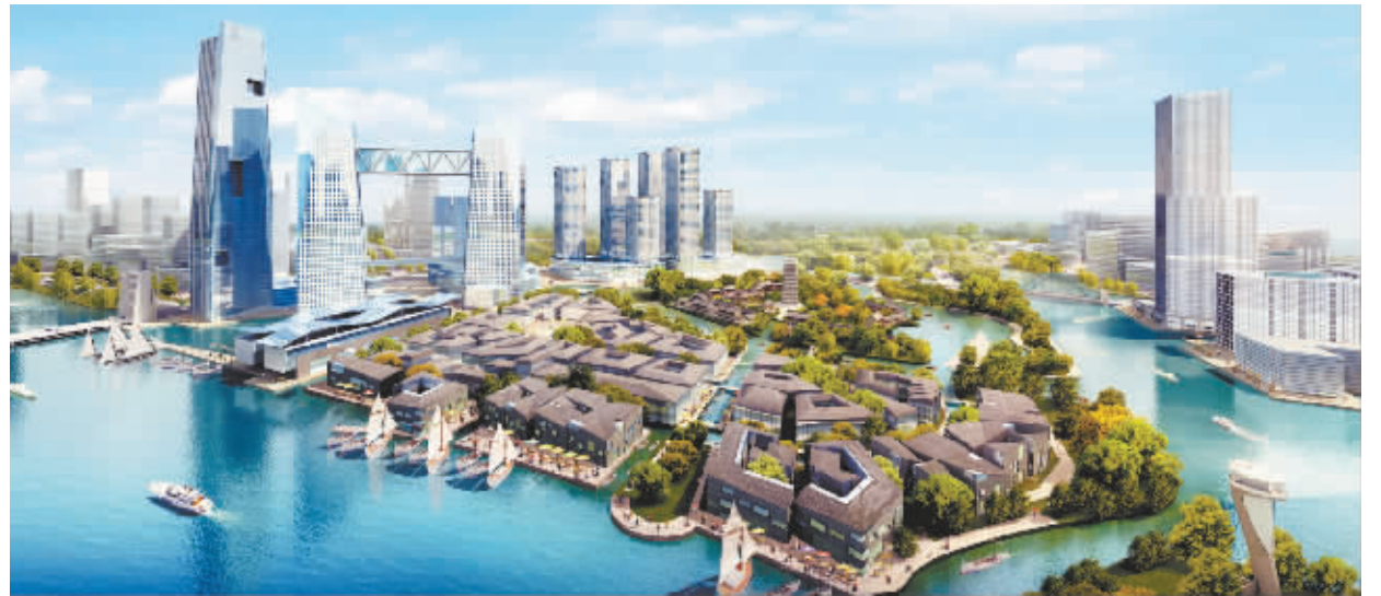
通州新城运河核心区效果图

明确了通州区的发展战略,即以建设北京现代化国际新城为目标,打造通州精神,创造通州速度,树立通州形象,实施新城中心区引擎、高端要素集聚、城乡一体化加速、国际化发展四大战略,实现区域经济发展、城市建设管理、城乡一体化发展三大跨越。