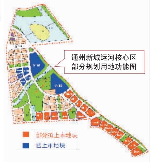
通州新城运河核心区部分规划用地功能图

为更好地体现运河生态和文化价值,核心区以源头岛和水乡区为景观中心,呈现现代化超高组团与传统低密度建筑群错落分布、合理布局的独特景观。建设成为白天因商务而繁荣,夜晚因娱乐休闲而繁华的不夜水城。