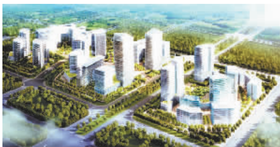
中关村壹号效果图

重点项目,将建设成为中关村高新技术产业发展的展示窗口,北部研发服务和高新技术产业聚集区的标志性建筑群,北清路沿线高科技产业聚集带的新地标和新区域。