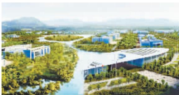
翠湖科技园效果图

中国人寿研发中心二期项目、华为研发中心四期项目、中科院计算所龙芯产业园二期项目、中关村壹号一期……海淀北部15个重大产业项目今年将陆续开工建设。据了解,这15个项目规划总面积151.02万平方米,项目总投资93.7亿元,预计本年度完成投资21.31亿元。海淀北部的建设再次提速。