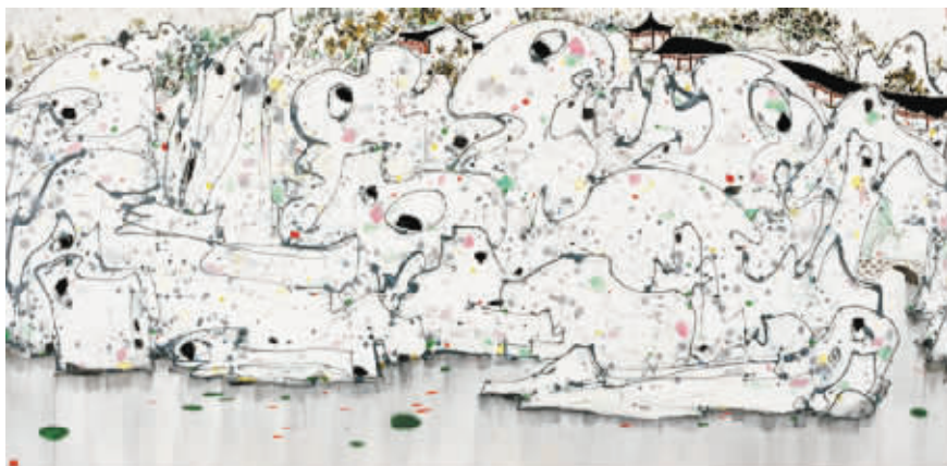
吴冠中《狮子林》成交价1.15亿元

吴冠中(1919-2010),20世纪现代中国绘画的代表画家之一,终生致力于油画民族化及中国画现代化之探索,坚韧不拔地实践着“油画民族化”、“中国画现代化”的创作理念,形成了鲜明的艺术特色。他执著地守望着“在祖国、在故乡、在家园、在自己心底”的真切情感,表达了民族和大众的审美需求,他的作品具有很高的文化品格;国内外已出版画集约40余种,文集10余种。吴冠中的画综合了西画与中国画之精髓,用笔简练,后期作品常喜以点、线造型,创自己独解,诠释自然之美,人生喻其中。