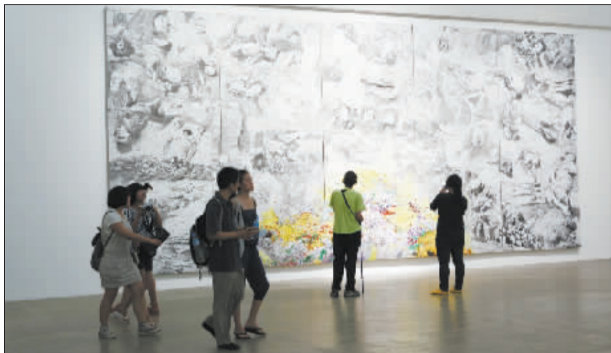
“各行其是”展览现场

下分析、消解和转化西方当代艺术的谱系。此次展出的油画作品中,《无题(加油站)》和《父亲III》将定格式的场景抽取出局部,经典的构图与画面的控制力形成一股奇怪的对抗。《火车上II》更加模糊的处理,让人展开对一个匿名的幻觉或潜意识画面无穷尽的理解。