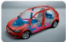
热成型高刚性工艺

上海大众汽车客户服务热线: 400-820-1111 产品网站: www.polochina.com