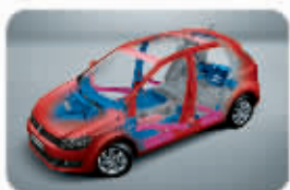
热成型高刚性工艺

上海大众汽车客户服务热线: 400-820-1111 产品网站: www.polochina.com